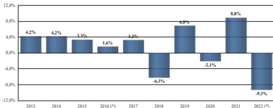
Rentabilidad de la IIC como pérdida o ganancia porcentual anual durante los últimos 10 años