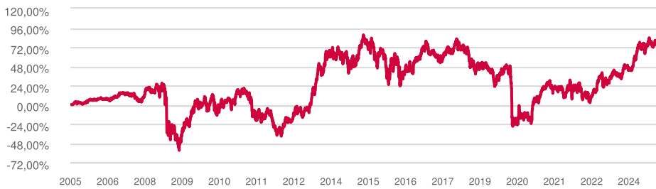
Evolución de la rentabilidad