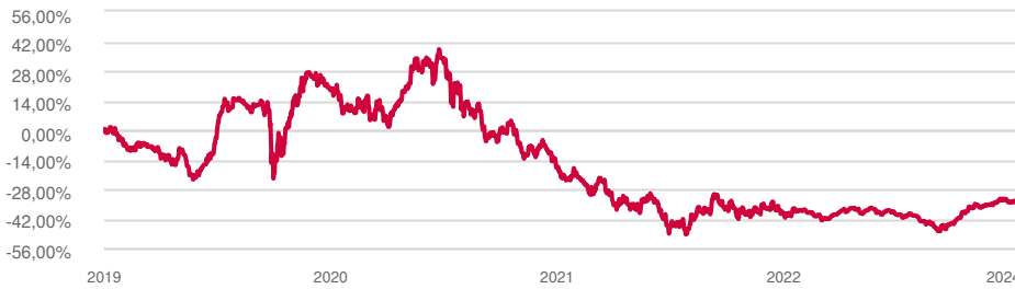
Evolución de la rentabilidad

*Rentabilidades pasadas no presuponen rentabilidades futuras.