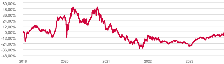
Evolución de la rentabilidad

*Rentabilidades pasadas no presuponen rentabilidades futuras.