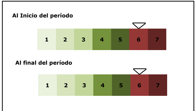
NIVEL DE RIESGO DE SU INVERSIÓN AL INICIO Y AL FINAL DEL PERIODO